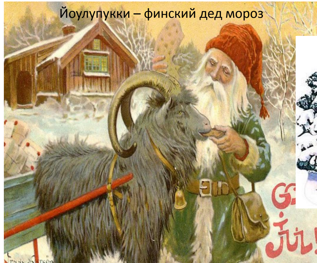
Йоулупукки – финский дед мороз