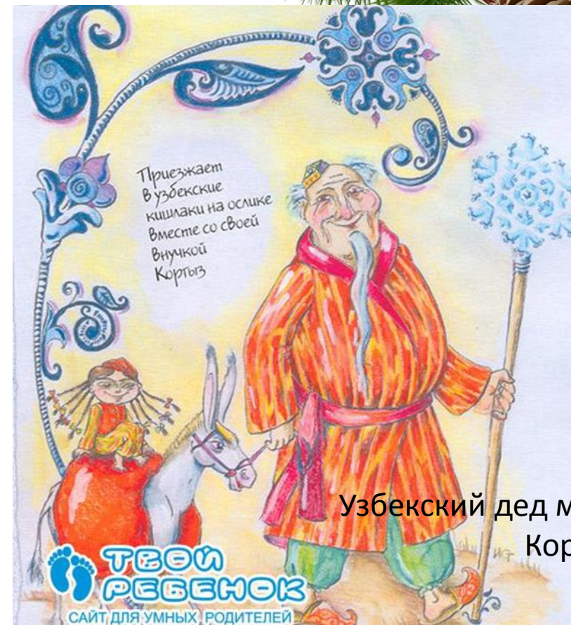
Узбекский дед мороз Корбобо