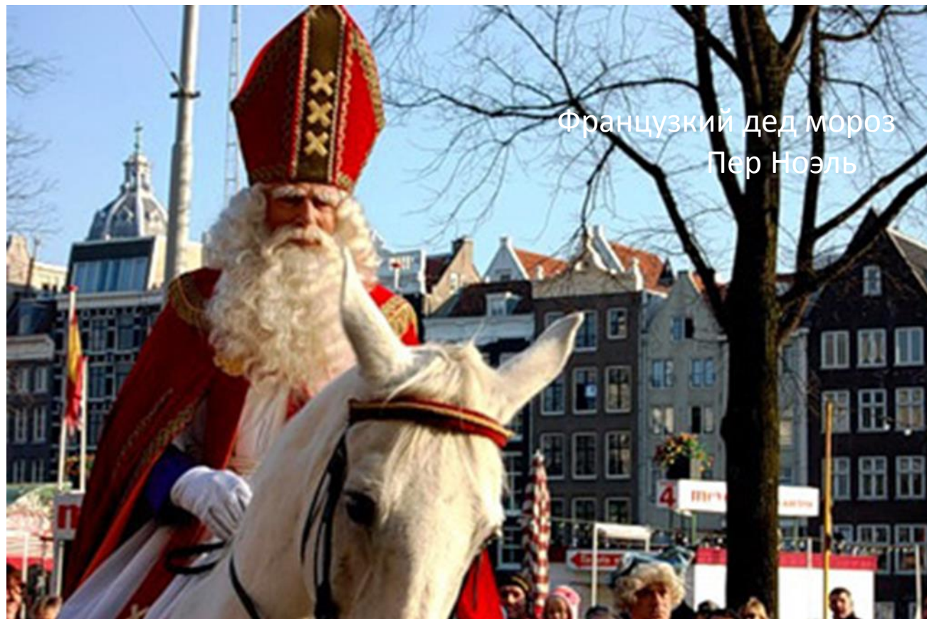
Французский дед мороз Пер Ноэль