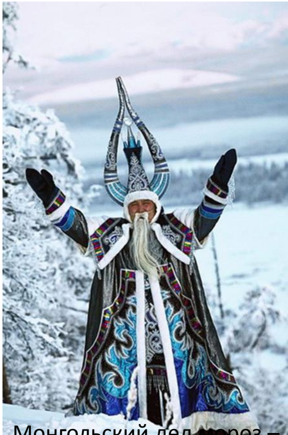
Монгольский дед мороз – Увлин Увгун