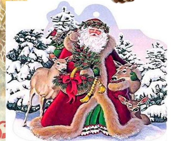
Итальянский дед мороз Баббо Наттале