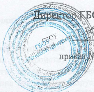
График питания на 2020-2021 учебный год